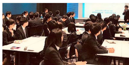
【イメージ】2019年11月開催の様子