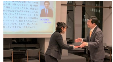
【イメージ】2018年3月の修了証授与の様子

■TKGパートナーズ・アカデミー特設サイト: https://www.tkg-jp.com/sdgs/case/index.html?tag=academy